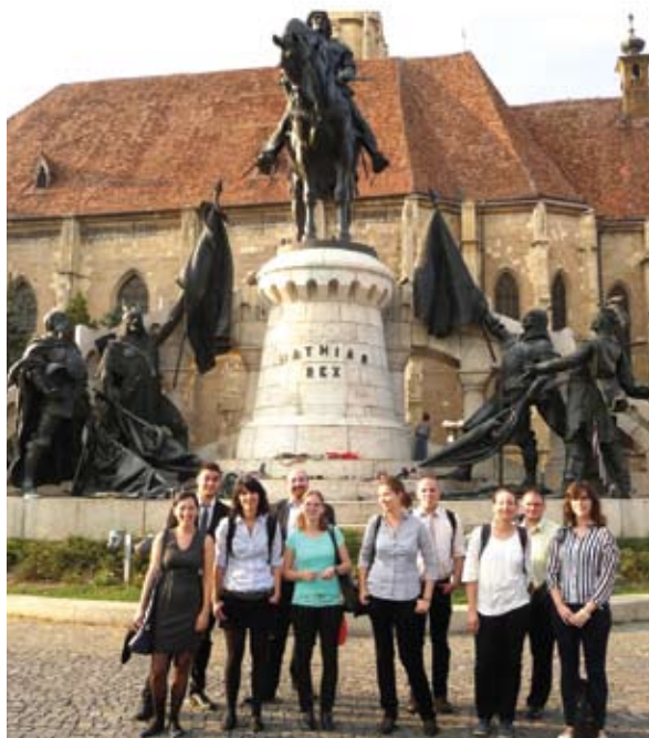
A Debreceni Egyetem történész hallgatói szakmai tanulmányúton Kolozsváron

Jyväskylä (Finnország) Clermont-Ferrand (Franciaország) Rostock és Marburg (Németország) Zaragoza (Spanyolország) Róma, Pisa (Olaszország) Tartu (Észtország) Muğla (Törökország) Eperjes és Nagyszombat (Szlovákia) Kolozsvár (Románia)