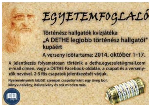
2014 őszi Történelem Szakbét vetélkedőjének plakátja

Ha kedvet kaptál, látogass el Facebook oldalunkra és nézd meg az Egyesület elmúlt egy évét képekben: